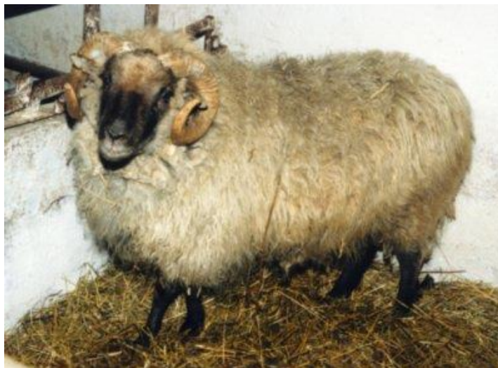
1. pav. Lietuvos vietinių šurkščiavilnių veislės avinas.

Veisimo tikslas: išsaugoti veislės genofondą. Avis būtina veisti grynuoju veisimu uždaru populiacijų metodu. Šios veislės avis rekomenduojama auginti nacionaliniuose parkuose, kaimo turizmo sodybose ir kitose žmonių lankomose vietose.